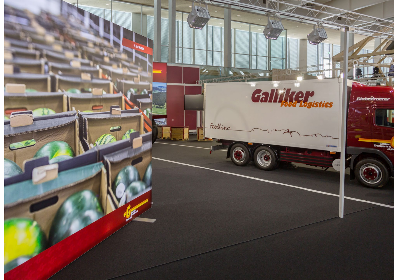
MÖGA 2016, Möhlin